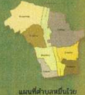
แผนที่ตำบลหมื่นไวย

ตำบลหมื่นไวยปกครองโดยองค์การบริหารส่วนตำบลหมื่นไวยเขตการปกครอง 9 หมู่บ้าน คร่าวเรือนทั้งหมด 5,688 หลังคาเรือน ประชากรทั้งหมด 10,841 คน แบ่งเป็น ชาย 5,089 คน หญิง 5,751 คน สภาพทางภูมิศาสตร์มีลักษณะเป็นที่ราบลุ่ม เป็นพื้นที่สำหรับทำปศุสัตว์ 45.14 % และเป็นพื้นที่สำหรับการเกษตร 54.86% ลักษณะดินตำบลหมื่นไวยโดยทั่วไปเป็นดินลิก มีกรรมชาน้ำไม่ดี เนื้อดินเหนียวจัดมีสีเทาเป็นจุดสีน้ำตาล น้ำดกปนเหลืองตลอดชั้นดิน แหล่งน้ำได้จาก คลองบุรีรัมย์, คลองชลประทานที่ 3-4, คลองสมบูรณ์สามัคคี